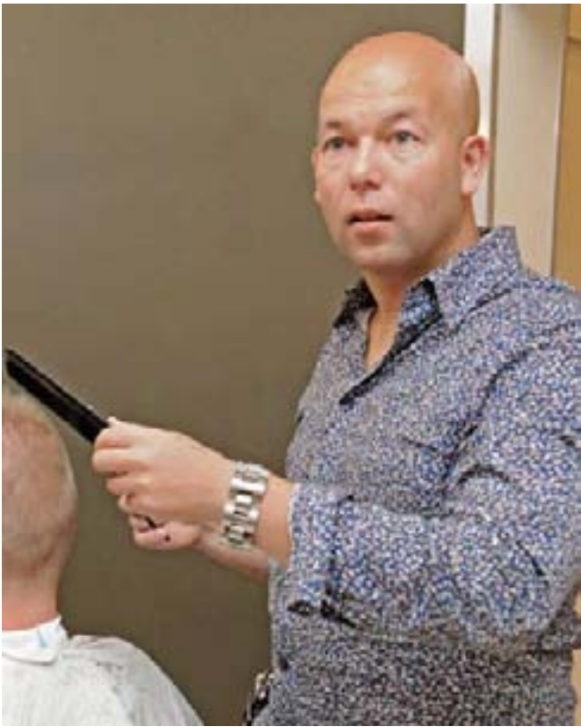
Theo van der Wouw