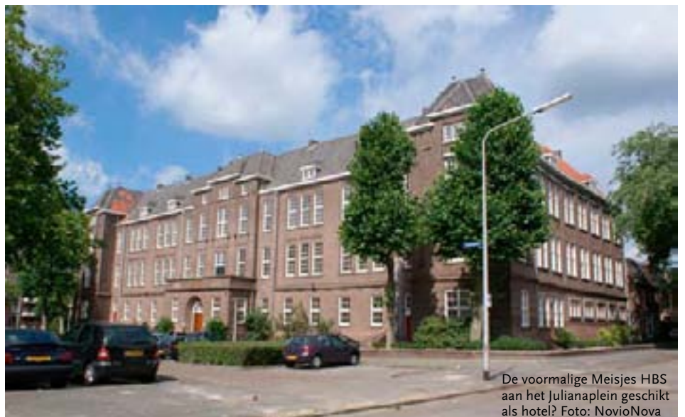
De voormalige Meisjes HBS aan het Julianaplein geschikt als hotel?