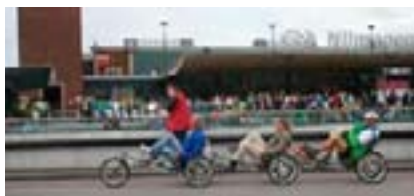
Een ligfietsreintje, hier voor het Nijmeegse station, dat ook op de Fietsmarkt 2008 te zien is.

De Fietsmarkt 2008 wordt door Fietsdiensten.nl georganiseerd in opdracht van de gemeente Nijmegen en mede mogelijk gemaakt door ondermeer Greenchoice, Decora Bloemdecoraties, Bo Green en BGH Accountants&Adviseurs.