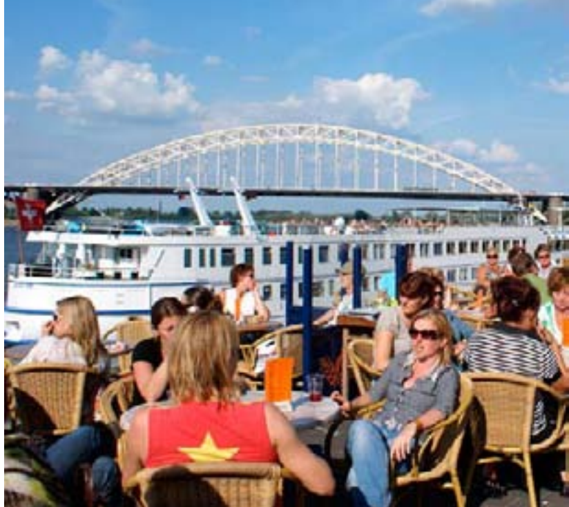
Al vanaf mei worden de Nijmeegse terrassen door een anonieme jury beoordeeld. Tweeëntwintig zijn er door naar de tweede ronde. In de finaleronde strijden nog 10 terrassen om de Zomerterrasprijs 2008.

Thonissen verder: "Uit die voorselectie zijn de beste 22 in de tweede ronde gekozen. Daaruit komen dan de laatste 10 kanshebbers naar voren. Uiteindelijk leveren die de grote winnaar van de Zomerterrasprijs 2008."