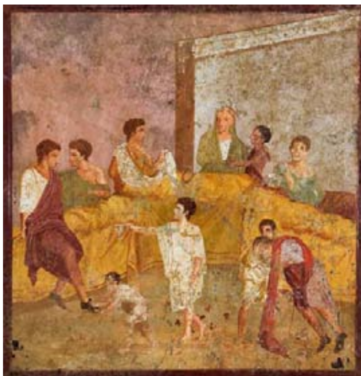
Wandschildering met banket-scène. Afkomstig uit Pompeii.

Zo ging de Hessenberg de bouwvak in. Erg nat, maar met gestorte betonvloeren. Zodat de bouwers na de vakantie, als alles wat droger is geworden, in augustus vlot verder kunnen. In het midden is duidelijk de afrit naar het kelderparkeerdek te zien.