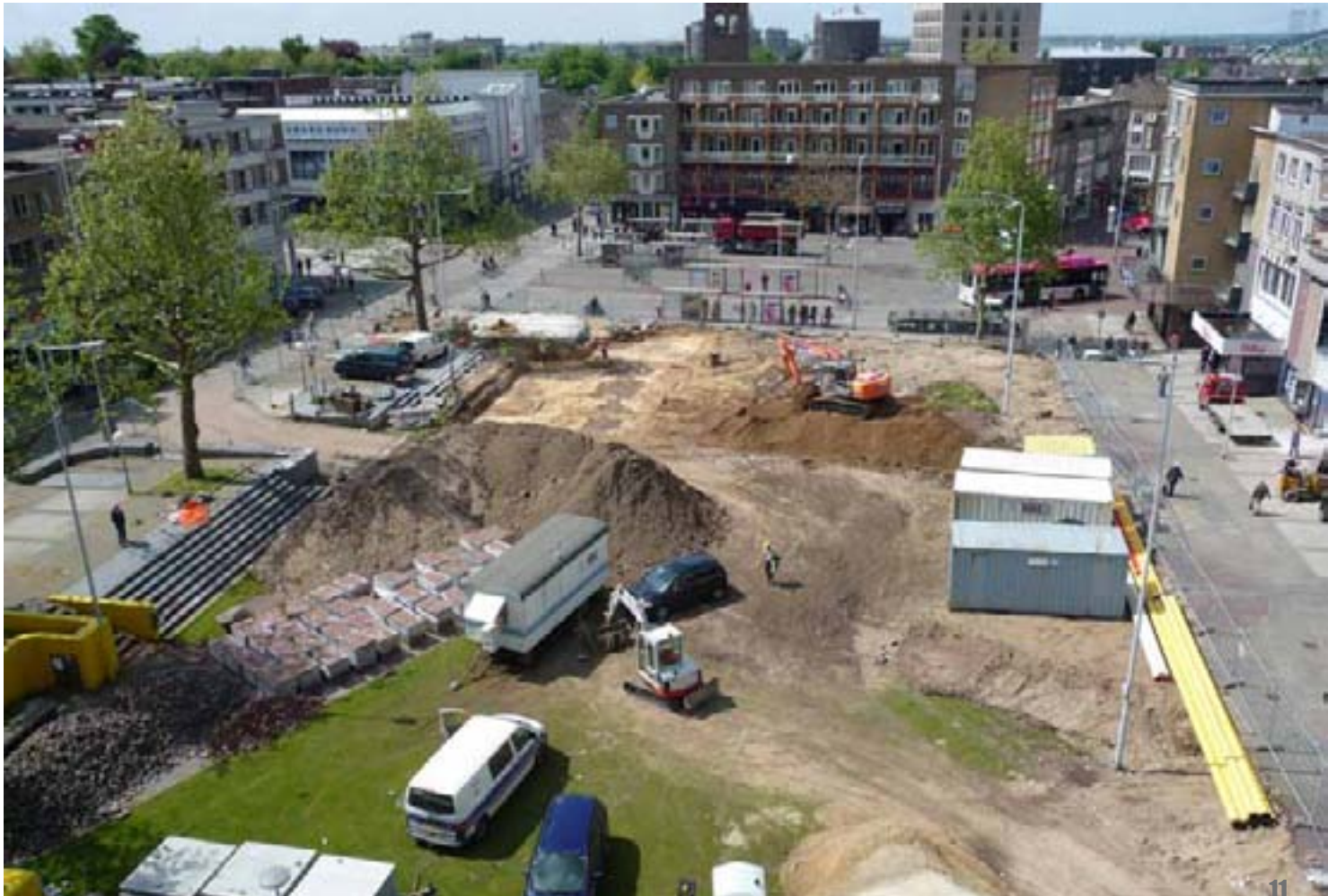
Plein 1944, half mei 2010, gezien door de lens van NN-fotograaf Edwin Stoffer.

Vanaf vorige week donderdag is in het Huis van de Nijmeegse Geschiedenis in de Mariënburgkapel de nieuwe tentoonstelling ‘De Verborgene Wereld van Plein 1944’ te zien. Aanleiding voor deze presentatie is de herontwikkeling van het stadsplein en de archeologische opgravingen die daar tot komend najaar plaatsvinden.